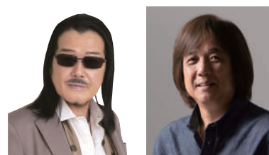
因幡 晃 三浦和人

抜群の歌唱力の「因幡晃」と楽しいトークを聞かせてくれる「三浦和人」のステージは、二人のヒット曲と懐かしい青春の曲を披露してくれます。