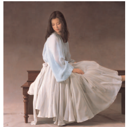
森本草介(未来)油彩

本展では、同館の代表的な所蔵品を中心に62点を紹介。絵画でありながら実物を見ているような、あるいは実物以上にリアリティを感じるような、驚きの写実絵画の世界をお楽しみください。