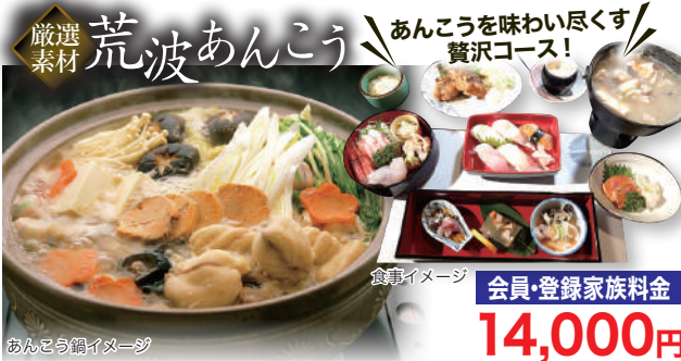
あんこう鍋イメージ