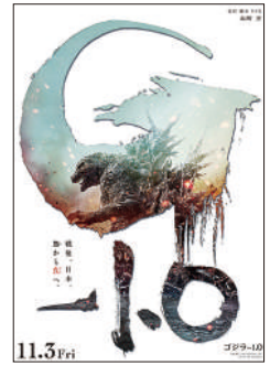
『ゴジラ-1.0』 (11/3(金)公開) ©2023 TOHO CO.LTD.

その他 ・抽選の結果は、払込票の発送をもってかえさせていただきます。 ・代金お支払い後または発送後のキャンセル・変更は受付できません。 ・シニア料金、ファーストデー(12月を除く毎月1日)、水曜サービスデー(毎週水曜日)の各種割引料金に「200円共通割引券」を使用すると、1,100円で鑑賞できます。