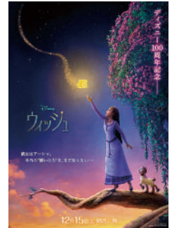
『ウィッシュ』 (12/15(金)公開) ©2023 Disney. All Rights Reserved.